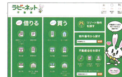
「ラビーネット不動産」のトップページ

ラビーネット不動産は、日本全国の購入物件情報を検索できます。業界で最も歴史がある公益社団法人全日本不動産協会が運営する安心・安全な不動産ポータルサイトです。