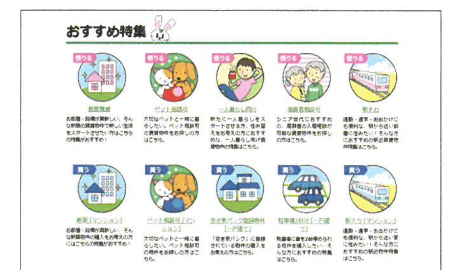
カテゴリーも豊富で検索もスムーズ